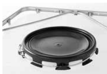
Ouverture en DN 400